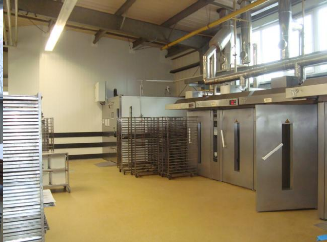
Ofenbereich mit Cool-Rising-Anlage