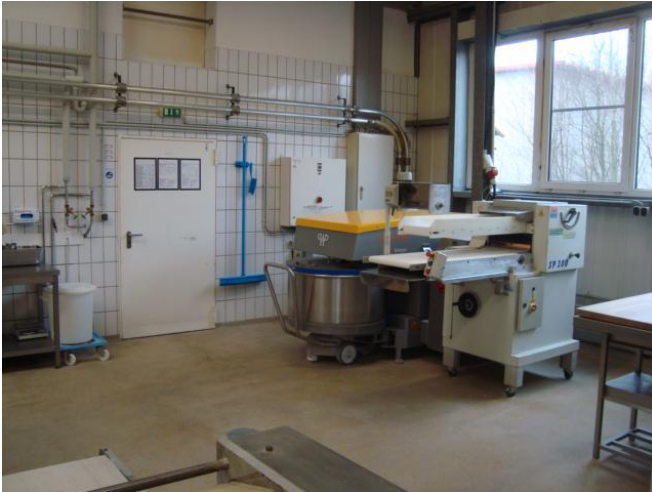
Teigherstellung mit Kronos-Spiralknetzer