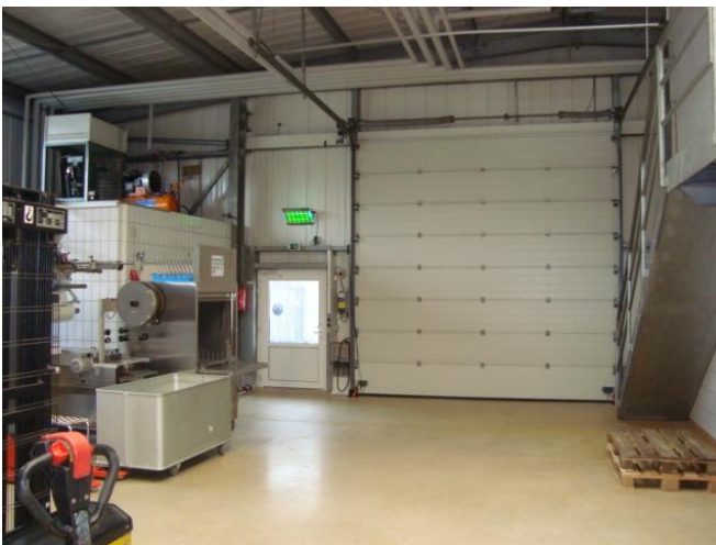
Verpackungsmaschine und Versandabteilung Lager OG