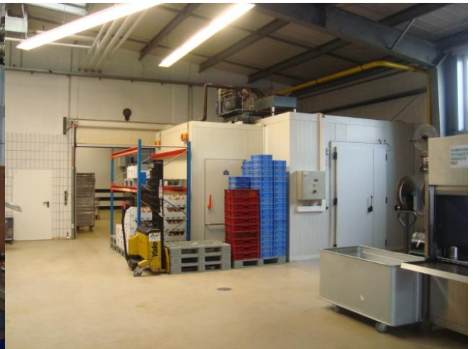
Kühl- und Kälteanlage Koma