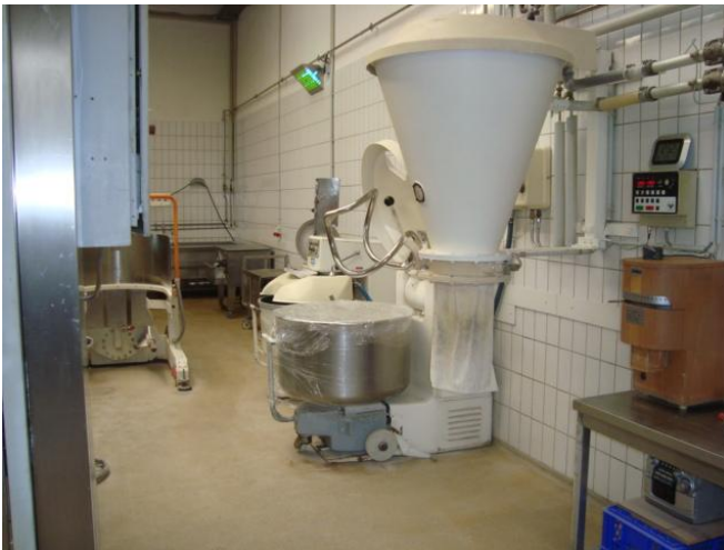
Verwiegung mit Siloanlage